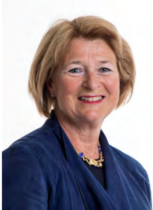
(Oslo) Kull 76