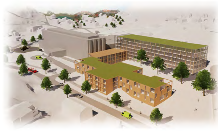
Nytt helsehus Harstad – ferdig 2024