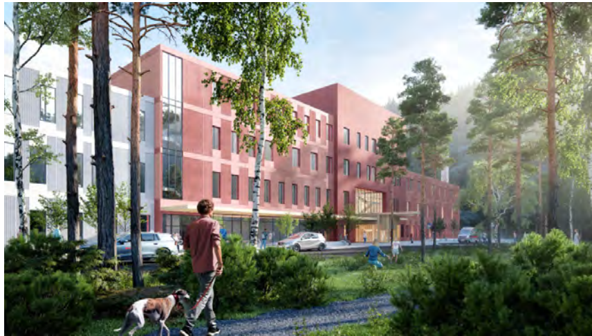
Nye UNN Narvik med helsehus – ferdig 2024

Snakke med hverandre - ikke om hverandre