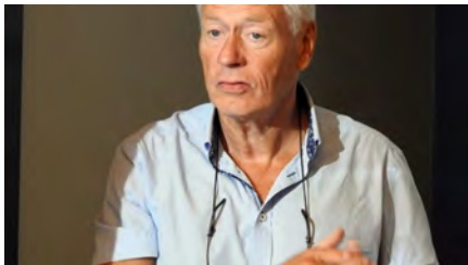
(Drøbak) Kull 73