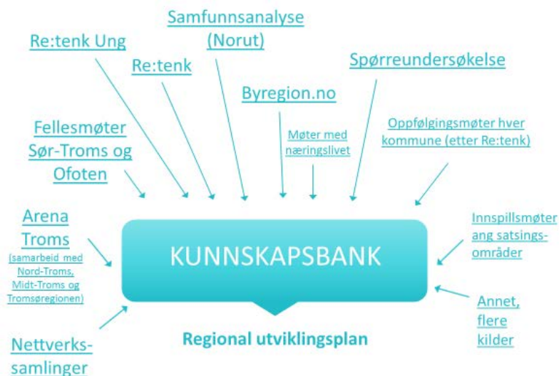
Fig.1 Kunnskapsbank – kunnskapsinnhenting for Sør-Troms